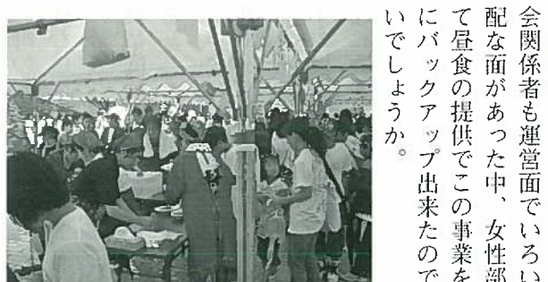
ちょっと待ってね

10月3日(日)、みやこ町内にてスポーツフェスタが初めて開催され、女性部も昼食で大会参加者を応援しました。当日は生憎の空模様の中、女性部員は前日から仕込んでいたカレーライスの準備に大忙し。カレーの提供開始前には雨も小康状態となりその頃にはテント前には長蛇の列が出来ていました。400食以上準備していたカレーライスは提供終了時間前になくなってしまふほどの大盛況で終了しました。今回みやこ町として初めてのスポーツフェスタの開催で、大