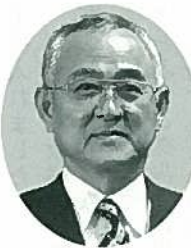
みやこ町 町長 井上 幸春

日頃から、みやこ町の商工業の発展に格別な尽力いただいております商工会の会長さまをはじめ会員のみなさまに厚く御礼申し上げます。