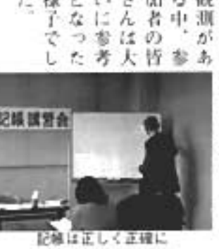
記帳は正しく正確に

税務署が、税の公平性の観点から今後個人事業者の記帳能力向上を重点的に指導していく観測がある中、参加者の皆さんは大いに参考となった様子でした。