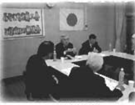
みやこ町の未来を語る

京築地域は東九州自動車道の整備や北九州空港開港、自動車産業集積など経済浮揚の千載一遇のチャンスを迎えています。行政と商工会が知恵を出し合い相互連携を深めて一層の地域活性化に取り組むことが求められています。